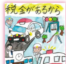
税金があるから 安心がある 芸濃小学校 5年 川口 柚音