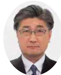
特別国税 調査官 早川 明氏