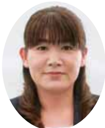
法人課税 第一統括官 中村彩子氏