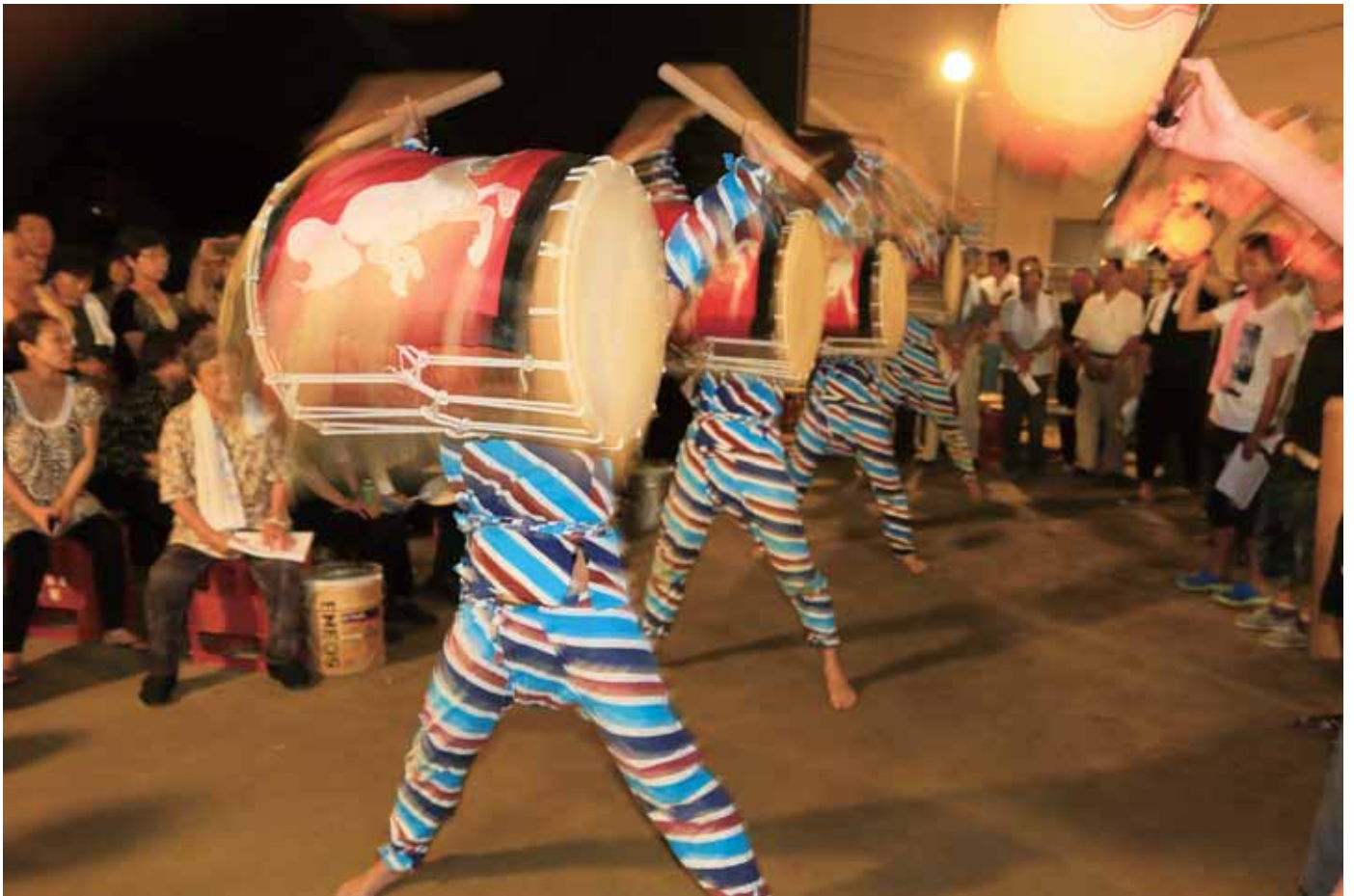
「香良洲宮踊り」(津市香良洲町)