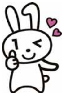
マイナンバーカード PRキャラクター マイナちゃん