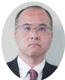
法人課税 第一統括官 広岡辰文氏