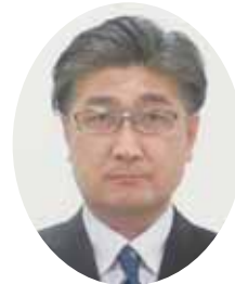
特別国税 調査官 早川 明氏