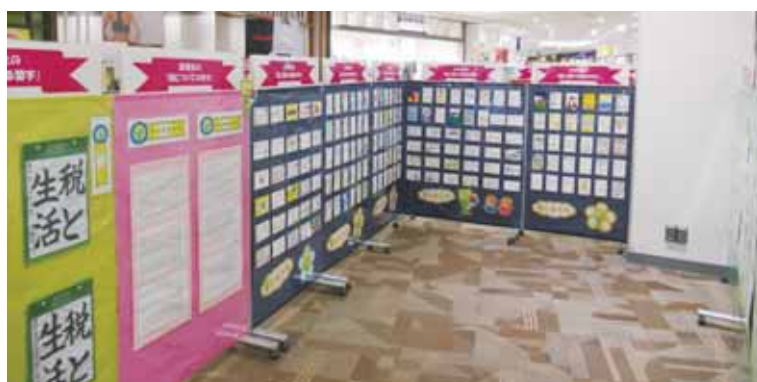
イオンモール津南

津税務連絡協議会が主催する「税に関する習字、作文、標語の優秀作品」入賞作品とともに、津法人会女性部会が担当した「税に関する絵はがきの優秀作品」もあわせて、イオンモール津南ショッピングセンター2F、津市役所1Fロビーと三重県津庁舎1Fロビーに展示されました。