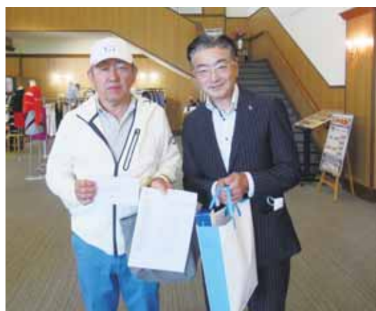
A I G 賞