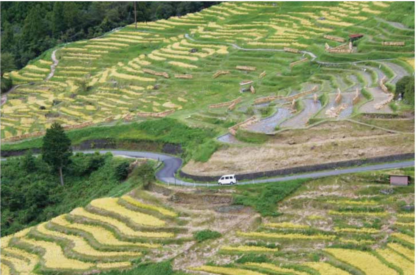
「丸山千枚田」(紀和町丸山地区)