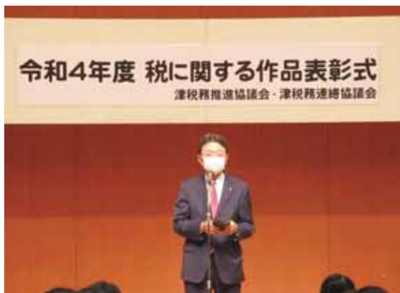
津税務連絡協議会会長

「税に関する習字、作文、標語の優秀作品」の表彰式が行われました。また受賞作品は、津法人会女性部会が担当した「税に関する絵はがきの優秀作品」もあわせて、イオンモール津南ショッピングセンター3F、津市役所本庁1Fロビーと三重県津庁舎1Fロビー（桜橋三丁目）に展示されました。